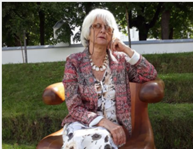
Žiemgalos Bitė (Šiauliai)